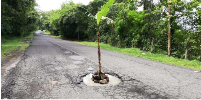
Eine Bananenstaude mitten auf der Straße

Die Straße von Gotera nach Perquin hat zum Ende jeder Regenzeit stets viele Schlaglöcher vorzuweisen, die eine große Gefahr für die Sicherheit im Straßenverkehr sind. Dieses Jahr war es besonders schlimm. Immer wieder wurden die zuständigen Behörden gebeten, die notwendigen Reparaturarbeiten durchzuführen, doch diese stellten sich taub. Junge Leute aus der Gemeinde Segundo Montes wählten daher eine sehr originelle Idee, um die breite Öffentlichkeit auf die schlechten Straßenverhältnisse aufmerksam zu machen: In die tiefsten Schlaglöcher pflanzten sie Bananenstauden! Die Aktion fand überregionales Echo, nicht nur in der Presse, sondern auch etlichen Radio- und Fernsehstationen, die darüber informierten. In den sozialen Netzwerken wurde gleichfalls sehr positiv darüber berichtet. Kaum eine Woche später besserten Arbeiter vom Ministerium für Öffentliche Bauarbeiten die schlimmsten Schlaglöcher auf dieser Friedenroute genannten Nationalstraße aus, die auch durch die Gemeinde Segundo Montes führt. - Soweit der Exkurs zu aktuellen Ereignissen in El Salvador.