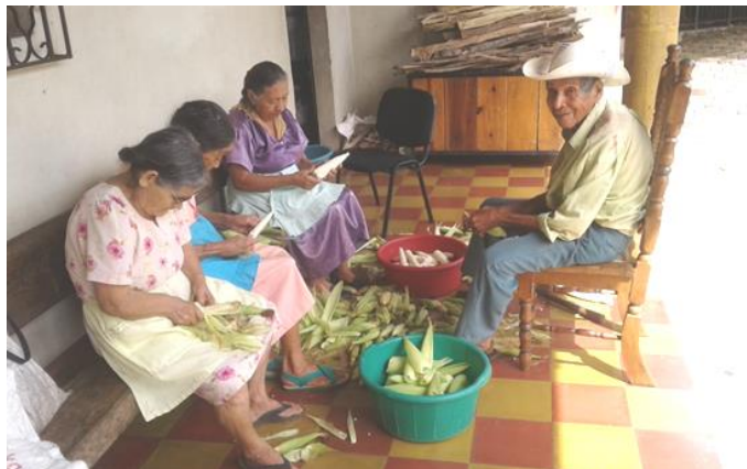
Der Mais wird entkörnt

säten sie auf traditionelle Weise, mit einem Guizute , das salvadorianische Grundnahrungsmittel Mais. Beim Guizute handelt es sich um eine Art Lanze, mit der ein Loch in den Boden gestoßen wird. Routiniert greifen sie danach in den umgehängten Behälter voller Saatgut, holen etwa vier Maiskörner heraus und werfen mit geübten Griffen, diese in das Loch im Boden. Dann ist das nächste Loch im Boden an der Reihe. Während der Reifezeit wird das Wachstum des Mais stets begutachtet und ist täglicher Gesprächsstoff unter den Männern. Feldarbeit ist Männerarbeit. Die diesjährige Ernte, Mitte August, fiel gut aus.