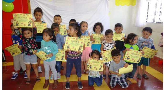
Jedes Kind bekam ein Diplom

Die von uns vorbereiteten Spiele machten den Kindern sehr viel Spaß. Vor allem die Bewegungs- und Tanzspiele, bei denen sie aus voller Kehle die lustigen und bekanntesten Lieder singen konnten, die sie bei ihren wöchentlichen Besuchen bei uns gelernt hatten, hatten es ihnen angetan.