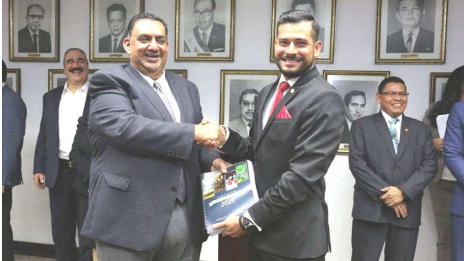
Finanzminister Fuentes (r) übergibt das Budget 2020

Auf diese Weise standen plötzlich mehr als 600 arbeitslose Angestellte dieser ehemaligen staatlichen Institutionen auf der Straße. Ihre Klage wurde am 15. Oktober vom höchsten Gericht des Landes zwar angenommen, aber noch nicht entschieden. ( Lapagina, 15.10.19 ).