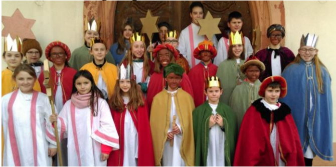
Sternsinger in Ebringen