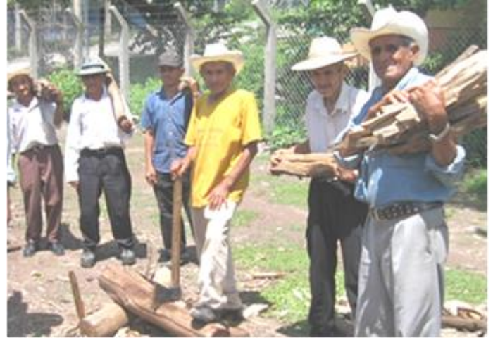
Unsere Senioren beim Holzhacken

nahmen und mich kaum loslassen wollten. Bald wurde mir klar, dass dies auch daran liegt, dass unsere Senioren zumeist allein oder irgendwo geduldet wohnen und daher sehr viel Liebe und Zuneigung brauchen. Diese möchte ich Ihnen gerne auch künftig geben.“