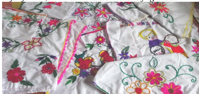
Kleine Stick-Kunstwerke unserer Seniorinnen

Dieser Workshop ist unter unseren alten Damen ein richtiger Renner. Für alle ist es eine sehr wichtige Erfahrung, da sie auf kreative Weise neue Muster und Motive erfinden. Wichtig ist ebenfalls, diese Erfahrung mit anderen zu teilen. Sie denken nicht mehr an ihre Krankheiten und auch die ständigen Kopfschmerzen sind weg. Manche von ihnen hatten zwar schon jahrelang nicht mehr gestickt, da sie ihnen die notwendigen Materialien dafür fehlten, doch nun sind sie wieder eifrig dabei.“