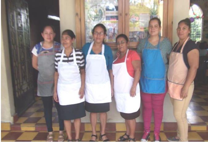
Unsere sechs Köchinnen

„In meinen Rundbrief-Beiträgen erwähnte ich immer die ausgewogene Ernährung und das gute Essen, das unsere Senioren in den drei Altenzentren bekommen. Heute möchte ich es nicht versäumen, die tägliche Arbeit der Frauen zu würdigen, die Tag für Tag diese nahrhaften Mahlzeiten in unseren drei Altenzentren zubereiten: unsere sechs Köchinnen. In jedem Zentrum arbeitet eine Köchin, die für die Zubereitung der Speisen verantwortlich ist. Daneben gibt noch eine Hilfsköchin, deren Aufgabe in erster Linie darin besteht, die Mais-Tortillas zu backen, die bei keinem Essen fehlen dürfen. Bei jeder Mahlzeit werden pro Senior zwischen zwei und drei Tortillas gegessen. Die Köchinnen sind zufrieden mit ihrer Arbeit, die ihnen viel Spaß macht.“