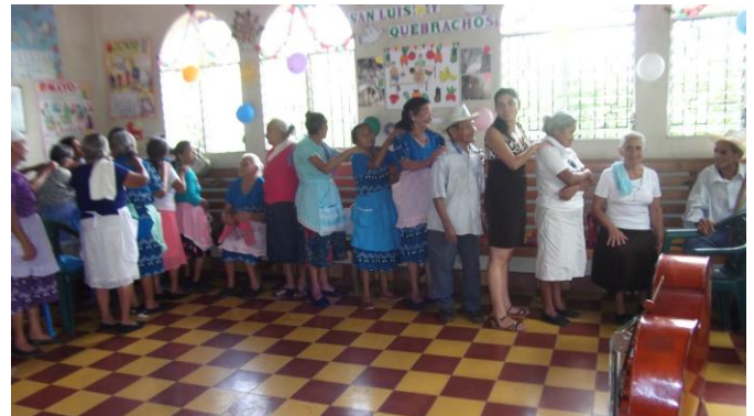
Fertigmachen zur Schlange

„Vor einigen Wochen, am 27. September, fand das alljährliche Treffen aller Senioren aus den verschiedenen Altenzentren im Altenzentrum von Hatos statt. Etliche hatten sich seit dem vergangenen Jahr nicht mehr gesehen: einige trauten sich die Fahrt mit einem öffentlichen Transportmittel nicht zu; andere waren schlecht zu Fuß, aber bei den meisten haperte es am notwendigen Kleingeld, um mit dem Bus in die einige Kilometer entfernt liegenden benachbarten Ortsteile zu fahren. Die Wiedersehensfreude war groß und manche wischten sich verstohlen ein paar Freudentränen aus dem Gesicht