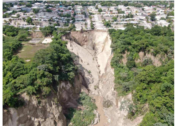
70 m tiefe Schlucht mitten in der Hauptstadt

El Salvador gehört zu einem der Länder, die sehr anfällig für Umweltkatastrophen sind. Darauf wies bereits vor etlichen Jahren eine Untersuchung der UNO hin und dies bestätigte sich erneut, als es Mitte Oktober, eine Woche lang, zu starken Regenfällen kam. In der Nacht vom 13. auf den 14. Oktober mussten in einem Vorort der Hauptstadt San Salvador etwa 250 Familien evakuiert werden, da es, bedingt durch die heftigen Niederschläge, zu starken Erdbeben gekommen war. Dies führte soweit, dass eine 70 m tiefe Schlucht entstand, welche Häuser und Anwohner dieses Ortsteils bedrohte. Nach Angaben der Bewohner waren rund 400 Häuser vom Einsturz bedroht. Glücklicherweise konnte die betroffene Bevölkerung rechtzeitig evakuiert werden, so dass keine Menschenleben zu beklagen waren. Sie wurden in Notunterkünften untergebracht, wo sie wohl eine Weile ausharren müssen. Die Gefahr eines Erdbebens in diesem Gebiet bestand schon seit einigen Jahren, doch die zuständigen Behörden blieben untätig. Dies rächt sich, denn nun sind Investitionen in Höhe von mehreren Millionen Dollar notwendig, um das Gelände zu sichern und um die weitere Erosion einzuschränken. (vgl. El Mundo 15.10.19 ).