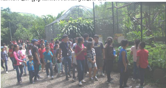
Wo haben sich die Tiere nur versteckt?

Am Dienstag, den 16. Juli war es soweit: die knapp fünfstündige Fahrt für die 105 teilnehmenden Kinder und deren 30 Teamer konnte losgehen. Die begeisterten Kinder genossen die Reise vom ersten Moment an, als sie in den Bus stiegen und schwatzten mit ihren Sitznachbarn. Da das Ausflugsziel den Busfahrern unbekannt war, suchten wir bereits vorher auf Google Map die Reiseroute aus und kamen zur geplanten Ankunftszeit an.