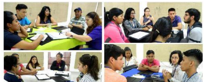
Erfahrungsaustausch innerhalb der Gruppen