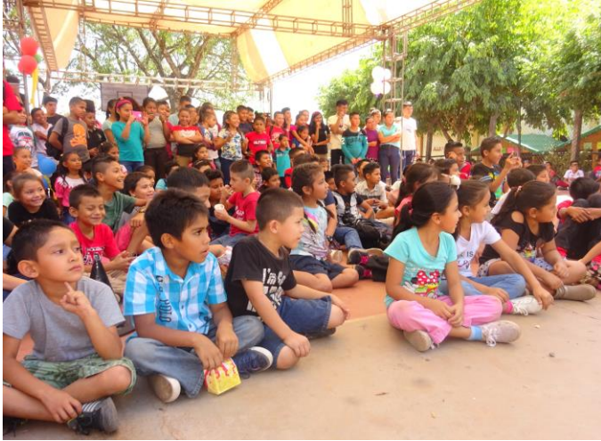
Spannend, was da abläuft!

Seit der Einweihung unseres Jugendzentrums vor nunmehr 17 Jahren hat für uns die Arbeit mit Kindern und Jugendlichen einen sehr hohen Stellenwert. Dies vor allem auch deshalb, da unser Department Morazán zu den stets am meisten vernachlässigten Departments des Landes gehörte und immer noch gehört, egal ob es sich um rechte oder linke Regierungen handelte. Unsere Kinder und Jugendlichen hatten keinerlei Möglichkeiten. Dank der solidarischen Hilfe von Euch konnten wir Ihnen die verschiedenen Möglichkeiten in den Bereichen Bildung, Weiterbildung und Freizeit anbieten, die sie in Anspruch nehmen können. Mit Hilfe unserer Angebote in den Sparten Sport, Kunst und Kultur haben sie einerseits eine Menge Spaß, lernen andererseits dabei aber neue Fähigkeiten sowie grundlegende Werte, die ihnen auf spielerische Weise vermittelt werden. Viele Kinder und Jugendliche sind in den verschiedenen Gruppen organisiert. Momentan haben wir 16 Kindergruppen. Das Alter der Kinder liegt zwischen 7 und 12 Jahren.