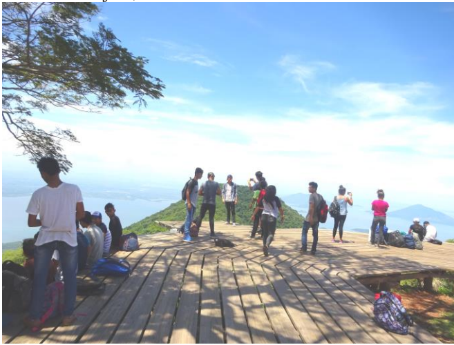
Auf dem Vulkan eine atemberaubende Aussicht

Conchagua hatte ich bisher jedoch noch nie bestiegen und ich wusste sofort, dass dies ein tolles Erlebnis würde.