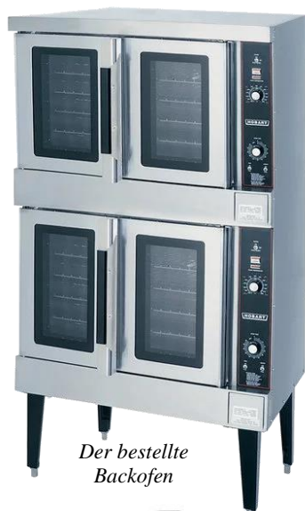
Der bestellte Backofen

Beim Besuch in einer befreundeten Bäckerei in der Hauptstadt wurde uns geraten, unbedingt einen Markenofen anzuschaffen. Allerdings ist eine solche Anschaffung sehr teuer. Da man solch einen Ofen