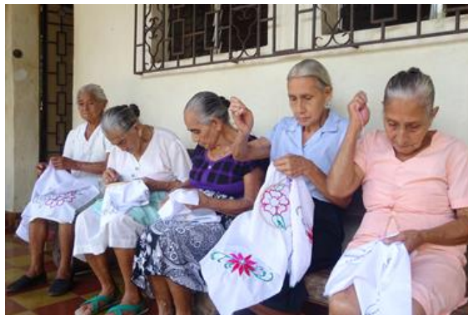
Stickerei macht einfach Spaß

„Seit gut zwei Monaten haben wir in allen drei Altenzentren einen Workshop für Stickerei-Arbeiten eingerichtet, der von unseren Seniorinnen sehr gut angenommen wird. Täglich kann man mehrere Frauen beobachten, die auf der Bank vor dem Altenzentrum sitzen und mit gebeugten Köpfen ihre angefangenen Stickerarbeiten Stich für Stich verschönern. Die an diesem Hobby interessierten Männer halten sich eher im Hintergrund auf, sprich innerhalb des Zentrums. Warum ein Stickerei-Workshop? Stickerei ist eine Aktivität, die es unseren Senioren ermöglicht, ihre Feinmotorik und die räumliche Orientierung zu stärken. Dadurch wird auch die Kreativität angeregt und ihr Erinnerungsvermögen gestärkt.“