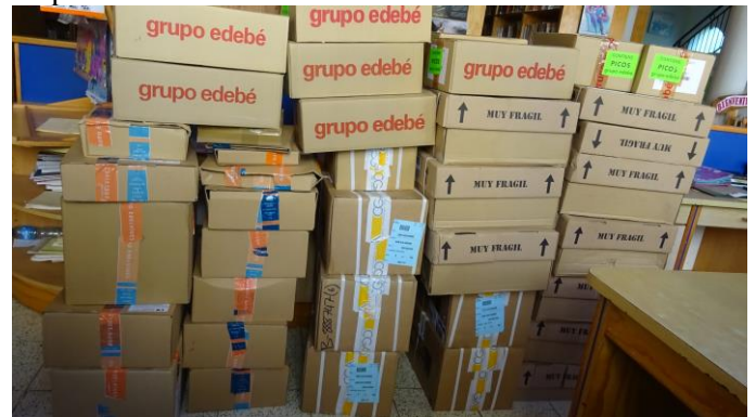
Die Bücherpakete waren am 1. April fertig zum Abholen

Ende vergangenen Jahres ließ uns die Partnerschaftsgruppe aus Schirgiswalde einen Betrag in Höhe von 5.500 € zukommen, den sie uns für den Kauf von Büchern zur Verfügung stellte. Nachdem wir im Jahr zuvor bereits gute Kontakte zu spanischen Verlagen geknüpft hatten, wollten wir diese erneut nutzen, um bei ihnen Bücher zu bestellen. Bereits im Vorfeld hatten wir mit ihnen einen Rabatt in Höhe von 40 % ausgehandelt, so dass wir nun mit obiger Spende eine höhere Anzahl an Büchern bestellen konnten. Leider kam es zu einigen Verzögerungen, da die Verlage uns ihre Buchkataloge erst relativ spät zukommen ließen. Danach machten sich unsere Bibliothekarinnen sofort daran, eine lange Wunschliste auszuarbeiten. Bei den meisten bestellten Titeln handelte es sich um Kinderbücher: Bücher für Kinder ab dem 1. Lebensjahr, Bilderbücher, Kinderbücher für das erste Lesealter, Märchenbücher sowie Abenteuerbücher. Es gab dann noch ein Hin und Her, da mehrere Bücher, die im Katalog aufgezeigt waren, nicht mehr vorrätig waren bzw. nicht ins Ausland verkauft werden durften. Bald waren auch diese Ungereimtheiten aus dem Wege geräumt und alle Bestellungen unter Dach und Fach. Ab 1. April waren bei allen Verlagen die verpackten Bücher abholbereit.