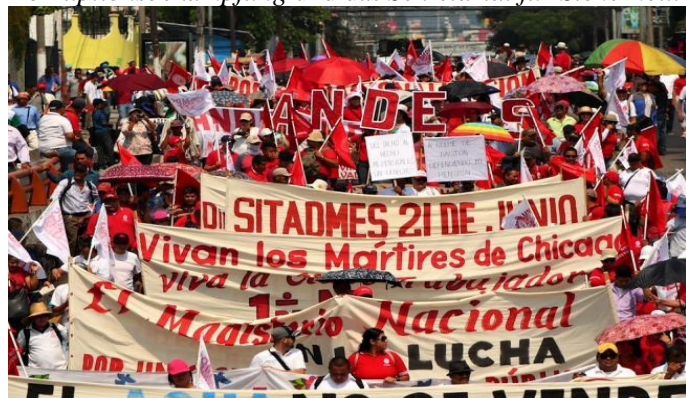
Proteste gegen Bukele nach 100 Tagen Regierung

Doch es blieb nicht nur bei einzelnen Entlassungen, ganze Institutionen wurden aufgelöst wie beispielsweise das Sekretariat für soziale Eingliederung , welches die Belange der Senioren, der Kinder, der Kriegsveteranen etc. vertrat. Weitere von Bukele aufgelöste Institutionen waren das Technische Sekretariat des Präsidiums , das Sekretariat für Politikgestaltung , das Sekretariat für Transparenz und Korruptionsbekämpfung und das Sekretariat für Sicherheit .