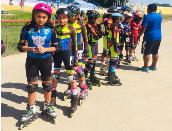
Unsere Mannschaft nimmt Aufstellung

„Am Sonntag, den 27. Oktober war unsere Inliner-Gruppe zu einem Wettbewerb nach San Miguel eingeladen. Wir hatten hierzu 15 Kinder angemeldet, 12 Jungs und 3 Mädchen. Außerdem begleiteten uns noch zwei Mütter und unser Trainer, so dass es in dem Kombi, (etwa so groß wie der legendäre Bulli), doch recht eng zuging. Wir fuhren um sechs Uhr früh los, da es, wegen mehrerer Baustellen unterwegs, immer zu langen Staus kommt.