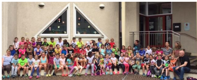
Schüler der Alb-Laucher-Schule in Veringenstadt