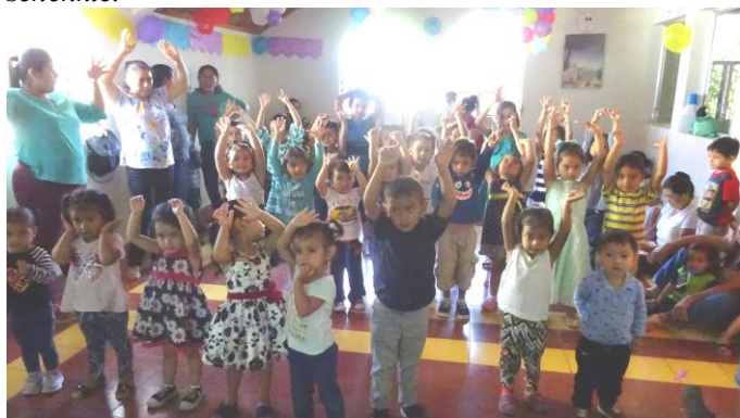
Alle Hände nach oben!

Die Kinder warteten bereits auf uns, als wir sie in ihren Krippen abholten. Frisch gebadet, umgezogen und in fröhlicher Stimmung, gespannt darauf, was wohl auf sie zukommen würde, wurden wir von ihnen erwartet. Eine Stipendiatin des Uni-Stipendienprogramms, die bei uns ihre sozialen Stunden leistete, hatte sich als Clown verkleidet, um alle Kinder willkommen zu heißen. Einige von ihnen waren anfangs etwas schüchtern, da sie sich vor dem Clown etwas ängstigten. Doch bald verflüchtigen sich ihre Befürchtungen, da der Clown jedem Mädchen und jedem Jungen einen großen und bunten Luftballon zum Spielen schenkte.“