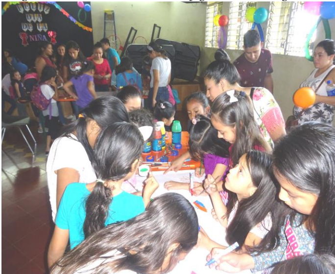
Die Wandzeitungen werden angefertigt

Es gab noch viele weitere, interessante Programmpunkte. Viele der Mädchen nahmen an einem Rätselraten teil, andere sprangen unbeschwert auf dem Trampolin, das heute exklusiv für die Mädchen aufgestellt war, denn wenn Jungs dabei sind, kommen sie häufig nicht zum Zug.