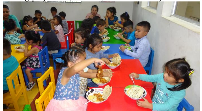
Ein leckeres Mittagessen zum Abschluss

Es handelte sich dabei um solche Lieder wie „Ich bin eine Tasse“, „Der Elefant Dante“, „Mutter Ente“, die „Elfenbeinstatuen“ usw. Es war ein Tag voller Lachen und mit viel Spaß für alle. Für einige der älteren Kinder bedeutete es aber auch Abschied zu nehmen, da sie im Dezember ihre Kinderkrippe verlassen, um im nächsten Jahr zur Schule gehen. Allen Kindern wurde ein von uns ausgestelltes Diplom überreicht. Der große Vorteil unserer Kinder gegenüber den anderen, die nicht die Kinderkrippe besuchten ist „Sie sind auf den Geschmack gekommen, Bücher zu lesen“. Dies konnten wir all die vergangenen Jahre über beobachten. Immer wieder kommen die Kinder zu uns in die Bibliothek, sei es allein oder zusammen mit älteren Kindern oder ihren Eltern, während die anderen, die nicht die Möglichkeit hatten, an unserem Bildungsprojekt teilzunehmen, kaum bei uns auftauchen.