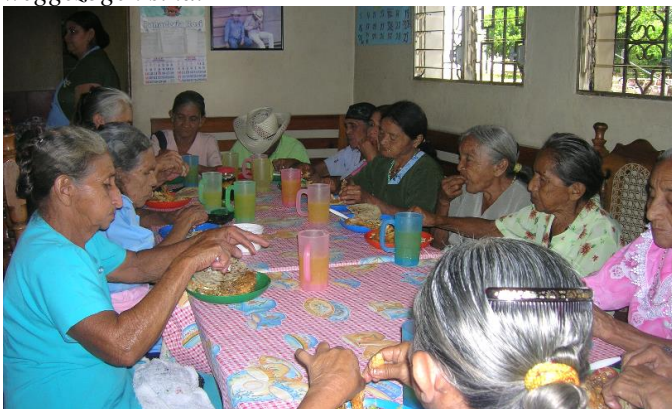
Am Mittagstisch mit einem Mango-Fruchtsaft

Ich begriff, dass das Alter eine Lebensphase ist, in der auch sehr viel Potenzial steckt, das es auszuschöpfen gilt. In unseren drei Altenzentren mit mehr als 100 Senioren arbeiten wir daran und motivieren sie, auch weiterhin etwas Neues zu lernen, trotz Alter, Krankheit und anderen Einschränkungen. Auf diese Weise wollen erreichen, dass unsere Senioren auch in ihrem letzten Lebensabschnitt mit dem notwendigen Wohlbefinden leben können. Weiter hinten werde ich Euch von einigen Workshops und Tätigkeiten erzählen, an denen unsere Senioren teilnehmen. Die Senioren, die in unserem Programm Alterspeisung integriert sind, haben kein Geld und sind hilfsbedürftig. Einige haben keine eigenen Kinder, da sie nie geheiratet oder eine Familie gegründet haben. Andere hatten früher eigene Familien, doch ihre Kinder starben im Säuglingsalter aufgrund mangelnder medizinischer Versorgung. Des Weiteren gibt es eine große Gruppe von alleinstehenden Senioren, deren Kinder im Krieg gefallen sind. Aus diesem Grund sind sie heute oft allein oder kamen bei entfernt Verwandten unter. Manchmal ist dies allerdings mit großen Konflikten belastet, da die Verwandten den Aufenthalt eines alten Menschen in ihrem Hause zwar dulden, doch sie kümmern sich nicht um ihn. Es gibt außerdem noch solche Fälle, wo sich noch lebenden Kinder nicht um ihre Eltern sorgen. Dies vor allem dann der Fall, wenn diese Kinder aus unserer Gemeinde weggezogen sind.