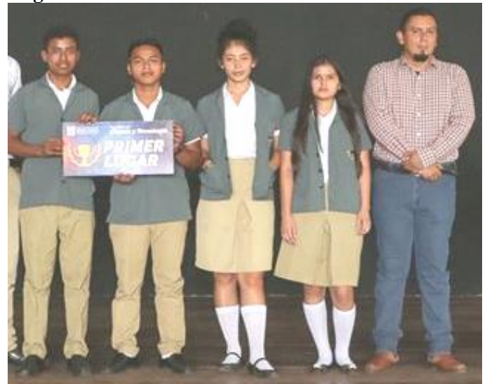
Unsere Siegergruppe mit ihrem Lehrer

Am 30. August fand an der Universität Gerardo Barrios in San Miguel der Wettbewerb „Innovate 2019“ statt, um Talent und Kreativität der Gymnasiasten im östlichen Landesteil von El Salvador zu fördern. Die teilnehmenden Schüler stellten in diesem Rahmen ihre Projekte in den Bereichen Robotik, Domotik, Arduino und anderen Alternativen der Informationstechnologie vor. In diesem Jahr beteiligten sich 7 Gymnasien, vier davon aus San Miguel. Auch unsere Elektronik-Stipendiaten vom