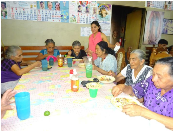
Eine Frauenecke bei der Alterspeisung

Beiden Geburtstagskindern, die zu meinem Altersjahrgang gehören, nachträglich unsere besten Glückwünsche und unser herzlichster Dank.