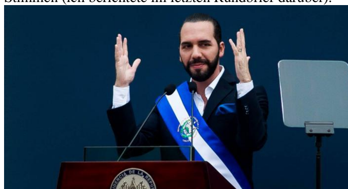
Der neue Präsident von El Salvador Nayib Bukele

Liebe Freundinnen und Freunde, Seit 1. Juni hat El Salvador den jüngsten lateinamerikanischen Präsidenten, Nayib Bukele. Bei der Wahl am 3. Februar dieses Jahres gewann er gleich in der ersten Runde sein Mandat mit 53,3% der abgegebenen Stimmen (ich berichtete im letzten Rundbrief darüber).