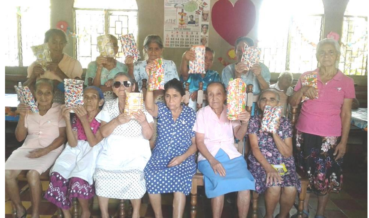
Dorila im Altenzentrum 2017

Nach diesen Untersuchungen wurde klar, dass Dorila Probleme mit ihrer Leber hatte, da diese größer als normal war und ihren Körper dazu brachte, Flüssigkeit zurückzuhalten. Zudem stellten die Ärzte fest, dass ihr Herz größer als normal war. Dies führte zu ihrer Kurzatmigkeit.