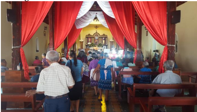
Beim Hlg. Jakobus (vorne rechts) in Torola

„Seit meinem letzten Bericht haben wir, zusammen mit unseren Senioren, wieder etliche Aktivitäten durchgeführt. Über zwei von ihnen möchte ich Euch kurz berichten.