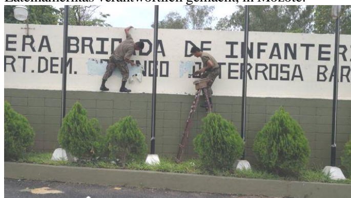
Soldaten löschen an der Kaserne den Namen von Monterrosa

Nach nur 17 Stunden im Amt erteilte der neue Präsident seinem Verteidigungsminister einen Befehl , den die Präsidenten der beiden früheren FMLN-Regierungen nie wagten: den Namen des Oberstleutnants, Domingo Monterrosa, an der Kaserne in San Miguel zu entfernen. Monterrosa wird von Menschenrechtsgruppen für das schlimmste zivile Massaker in der modernen Geschichte Lateinamerikas verantwortlich gemacht, in Mozote.