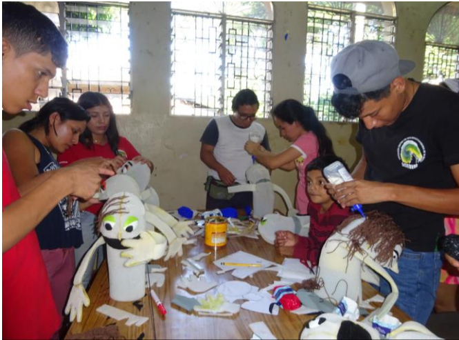
Die Teamer basteln Marionetten

Dies wurde gleich geübt, als die Marionetten fertig waren. Eine Runde wurde gemacht: jemand fing mit einer Geschichte an, der nächste ergänzte sie usw. Auf diese Weise entstand in jenem Workshop die Geschichte vom liebenden Wolf. Für alle Teamer unserer Gruppen war es ein großartiger Workshop.“