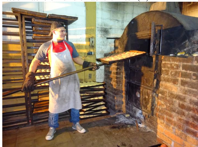
Der Backofen der Bäckerei Rosi vor 5 Jahren

In meinem Rundbrief vom vergangenen Jahr informierte ich Euch über die Situation der Bäckerei Rosi, eines unserer sogenannten produktiven Projekte. Zur Erinnerung: Die Bäckerei wurde im Jahr 1995 gegründet und wurde