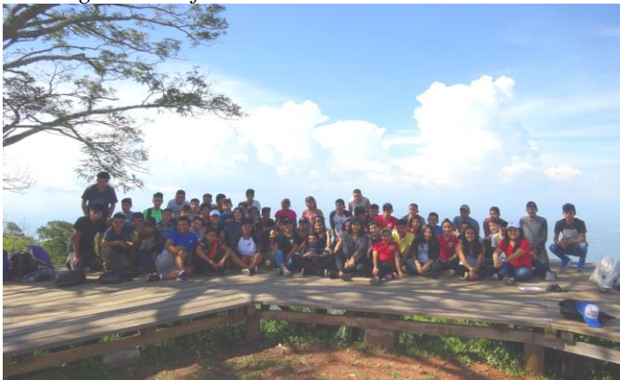
Gruppenfoto auf dem Vulkan Conchagua

Auf der Ladefläche eines LKW fuhren wir in die Nähe des Vulkans. Danach stand uns ein sehr steiler Aufstieg bevor. Eine große Herausforderung für mich! Doch die Zeit verging ziemlich rasch, angefüllt mit Gesprächen, bei denen wir unter anderem über Freundschaft, Kameradschaft, Respekt und Verantwortung von uns Menschen gegenüber der Natur quatschten, wobei man die Mühen des Aufstiegs weniger stark wahrnahm. Wir achteten ebenfalls darauf, möglichst keinen Müll zu verursachen bzw. ihn nicht wegzwerfen. Glücklicherweise machte das Wetter mit und es war nicht gar so heiß. Trotzdem war es doch sehr anstrengend und immer wieder mussten wir eine Pause einlegen. Nach zwei Stunden anstrengendem Fußmarsches erreichten wir unser Ziel.