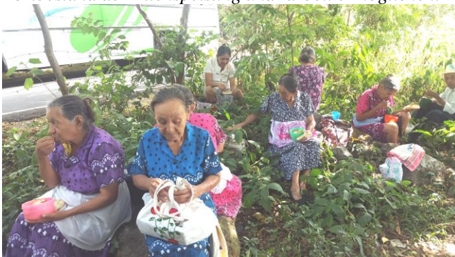
Rast unter dem Amate Baum

Am 24. Juli veranstalteten wir einen Ausflug in das benachbarte Dorf Torola, um Sankt Jakobus zu besuchen. Es handelt sich bei ihm um einen Heiligen, der von unseren Senioren sehr verehrt wird und laut ihren Aussagen, sehr wundertätig wirkt. Leider konnte nur die Hälfte unserer Senioren am Ausflug teilnehmen, da sich viele andere ein Grippe-Virus eingefangen hatten. Auf der Hinfahrt hielten wir unterwegs an, um im Schatten eines großen Baumes zu frühstücken. Unsere Schar wurde vom Pfarrer von Torola begrüßt, der anschließend mit uns zusammen die Patronatsmesse feierte. In seiner Predigt sprach er über das Gleichnis vom Sämann. Im Gottesdienst wurde auch voller Dankbarkeit aller Spender gedacht, die den Fortbestand der Alterspeisung und -arbeit ermöglichen.