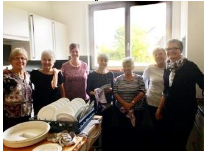
Die Frauen vom Besuchsdienst in Rheinheim

Im nächsten Monat möchten wir in der Bäckerei einen eigenen Raum mit Abzugsmöglichkeiten für den neuen Backofen herrichten. Dies bedeutet, die Wände zu verputzen, neue Boden und Wandfliesen zu verlegen, ein potentes Rauchabzugssystem einbauen etc. Außerdem müssen sowohl ein größerer Gastank sowie das für den Betrieb notwendige Gasleitungs-System gekauft und fachlich einwandfrei verlegt werden. Gleichfalls werden neue Elektroanschlüsse benötigt werden. Es gibt noch einiges zu tun, wenn wir dann im Januar mit dem Betrieb des neuen Backofens anfangen möchten.