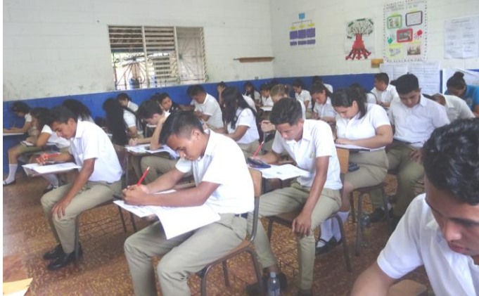
Tief gebeugte Köpfe über den Abitursfragen

Der Trend, an Gymnasien mehr Nachhilfe in den Prüfungsfächern zu Lasten der Nebenfächer anzubieten, ist steigend. Jedes Gymnasium möchte vorne mitmischen, denn die drei besten Gymnasiasten aus jedem der 14 Departments erhalten vom Erziehungsministerium ein Stipendium für das Studium an einer Hochschule. Landesweit werden insgesamt also nur 42 Stipendien vergeben, bei denen es sich nicht um volle Stipendien handelt, da der Förderbetrag nur dafür ausreicht, die monatlichen Studiengebühren der Universität zu bezahlen.