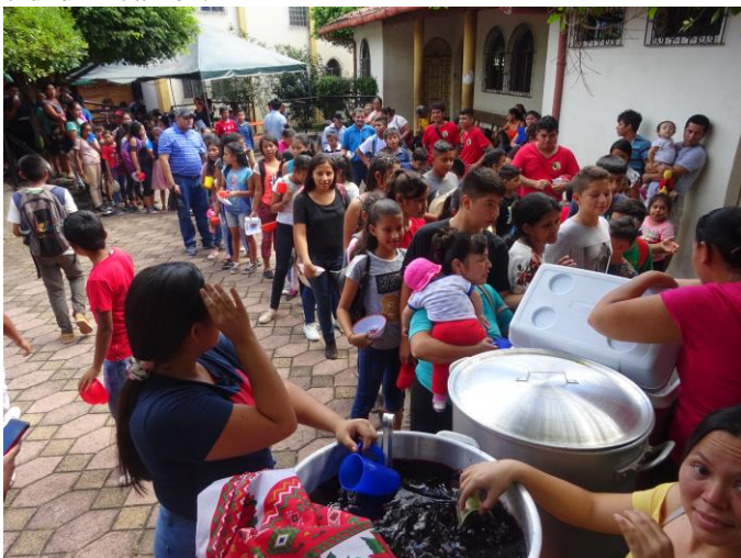
Fertigmachen zum Essen fassen!

Seit der Einweihung unseres Jugendzentrums vor nunmehr 17 Jahren hat für uns die Arbeit mit Kindern und Jugendlichen einen sehr hohen Stellenwert. Dies vor allem auch deshalb, da unser Department Morazán zu den stets am meisten vernachlässigten Departments des Landes gehörte und immer noch gehört, egal ob es sich um rechte oder linke Regierungen handelte. Unsere Kinder und Jugendlichen hatten keinerlei Möglichkeiten. Dank der solidarischen Hilfe von Euch konnten wir Ihnen die verschiedenen Möglichkeiten in den Bereichen Bildung, Weiterbildung und Freizeit anbieten, die sie in Anspruch nehmen können. Mit Hilfe unserer Angebote in den Sparten Sport, Kunst und Kultur haben sie einerseits eine Menge Spaß, lernen andererseits dabei aber neue Fähigkeiten sowie grundlegende Werte, die ihnen auf spielerische Weise vermittelt werden. Viele Kinder und Jugendliche sind in den verschiedenen Gruppen organisiert. Momentan haben wir 16 Kindergruppen. Das Alter der Kinder liegt zwischen 7 und 12 Jahren.