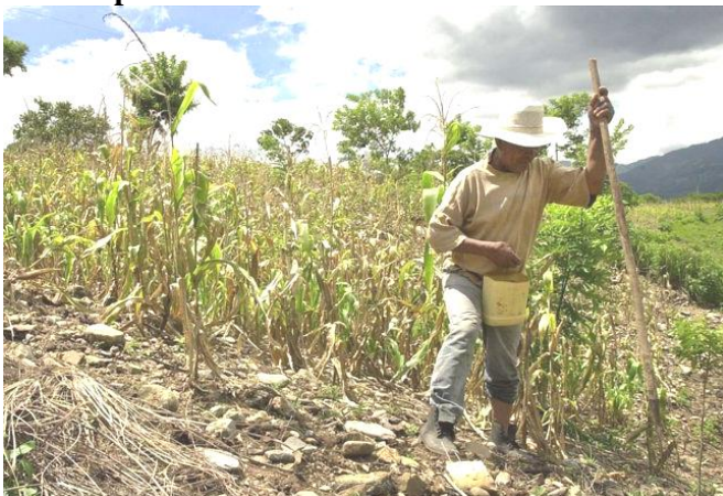
Die zweite Aussaat neben vertrocknetem Maisfeld

In den ersten drei Monaten der Regenzeit litt El Salvador immer wieder unter kürzeren Dürre-Perioden ohne Niederschläge. Obwohl dies nicht so lange dauerten, wie im vergangenen Jahr so wirken sich diese, laut der Aussagen der Landwirtschafts-Kammer der kleinen und mittleren Produzenten, negativ auf die Ernte aus. Das hiesige Umweltministerium verzeichnete in diesem Jahr bisher sechs Dürreperioden, wobei diese bei uns im Osten des Landes länger dauerten, als in den übrigen Landesteilen. Für das Landwirtschaftsministerium war "die diesjährige Regenzeit besser als im vergangenen Jahr (...). Einige Probleme gab es nur im Osten des Landes . Bei der momentanen Aussaat der Bohnen regnete es ebenfalls kaum“ (vgl. Prensa Grafica, 15.09.19 ). Der aktuelle Preis von 1 Quintal Mais (knapp 50 kg) beträgt 23 kg und er liegt damit im Vergleich etwas über dem üblichen Durchschnittspreis.