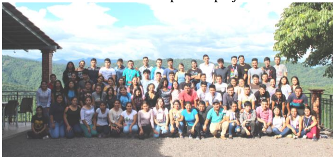
Unsere derzeitigen Uni Stipendiaten

Ein weiteres, sehr wichtiges Bildungsprojekt sind unsere Universitätsstipendien , die seit dem Jahr 2003 vergeben werden. Das Projekt soll eine konkrete und wirksame Antwort auf die bestehende Armut sein, unter denen unsere Gemeinden gelitten haben und immer noch leiden und soll die damit verbundene soziale und bildungspolitische Ausgrenzung ändern und jungen Leute eine bessere Lebensperspektive ermöglichen. Außerdem erwies es sich als notwendig, aus unserem Department Morazán stammende Fachleuten heranzuziehen, die auch nach Studienende in ihren Gemeinden arbeiteten und dort wohnten und nicht externe Akademiker, die nach einem kurzen Aufenthalt hier bald wieder in ihre Herkunftsorte zurückkehrten. Im ersten Jahr waren es nur fünf junge Leute, die wir unterstützen konnten. Ihr Stipendium war minimal und deckte gerade mal die Studiengebühren. Anfangs wurden nur junge Leute aus der Gemeinde Segundo Montes unterstützt. Da Armut und Ausgrenzung aber auch in den Nachbargemeinden an der Tagesordnung sind wurde unser Projekt auch für sie geöffnet. Bisher wurden junge Menschen aus 16 der 26 Gemeinden von Morazán von unserem Uni-Stipendienprojekt unterstützt.